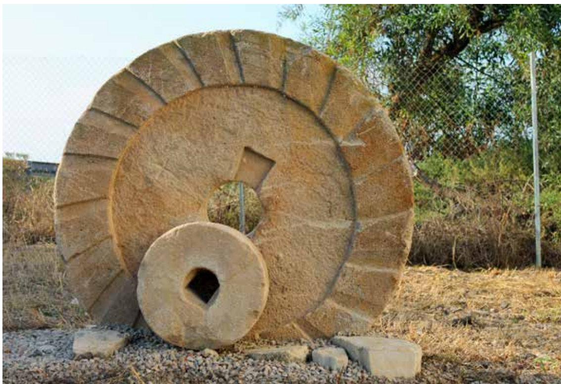
Pedra del molí de Múzquiz.