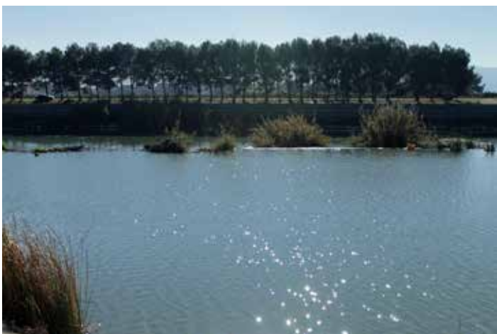
Assut de Sueca.