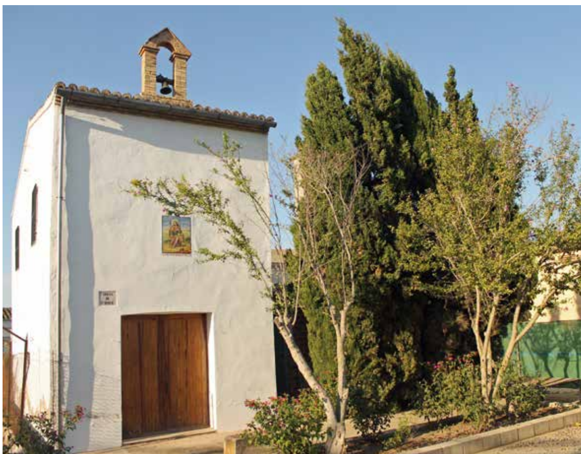
Ermita de Sant Roc.