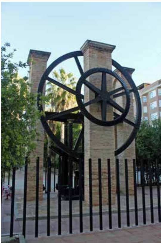
Roda del molí arrosser de Marco.