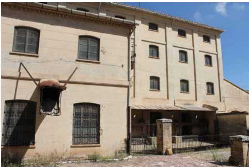
Molí arrosser del Passiego.