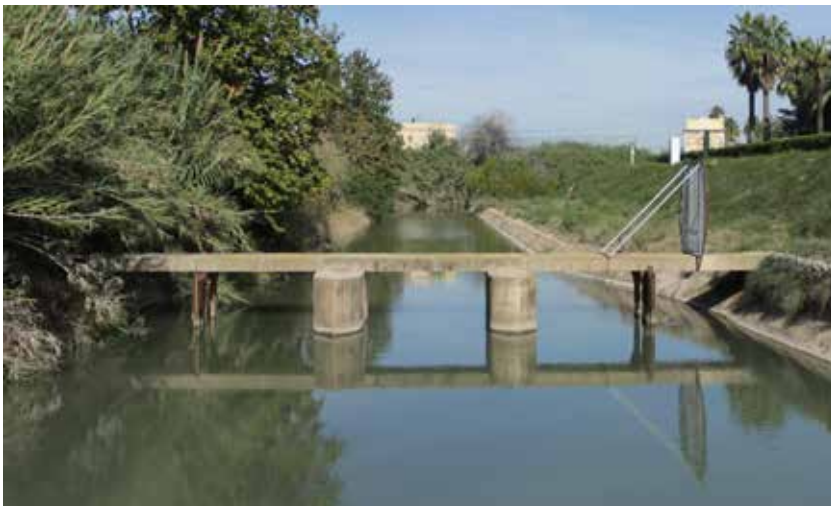
Naixement de la séquia Major, des del riu.