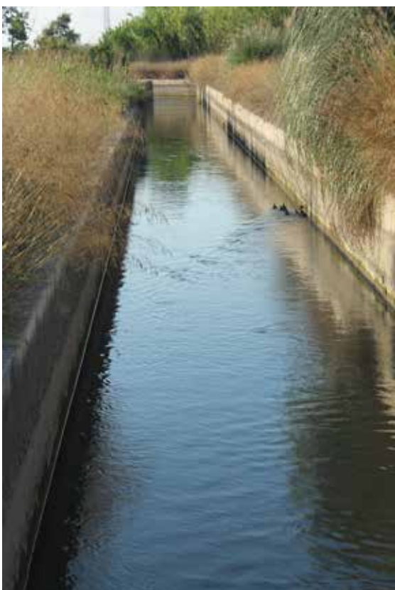
Caixer de la séquia de Múzquiz.