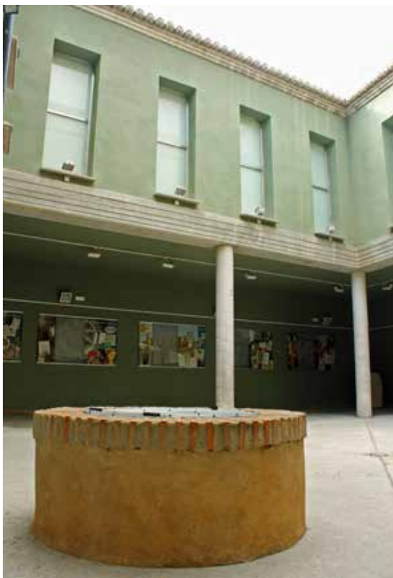
Pou de casa Fuster.