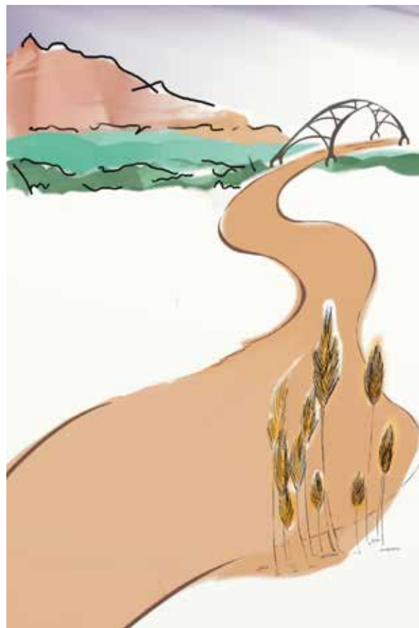
Camí del Sitan.

Si ja heu llegit o vos han contat les rondalles dels Animals de séquia podeu començar amb nosaltres una visita, real o imaginària, al món de les séquies, de la marjal, del riu Xúquer i de l'Albufera. Una visita feta amb els ulls de la realitat i els de la fantasia, perquè amb quatre ulls vorem més que amb només dos, i els carrers, els pous, les muralles, els ponts de ferro, les pedres de molí, els camins i les séquies adquiriran una nova dimensió: la del paisatge convertit en emoció. Per a nosaltres el treball dels nostres avantpassats i la transformació que amb la xarxa de séquies s'ha produït en el territori és un símbol que s'ha de conèixer, estimar i conservar.