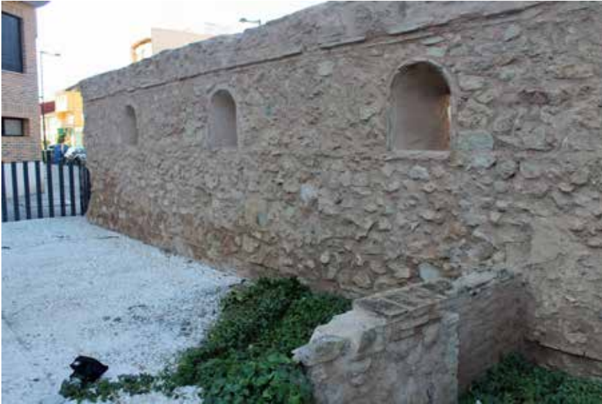
Restes de la Muralla.