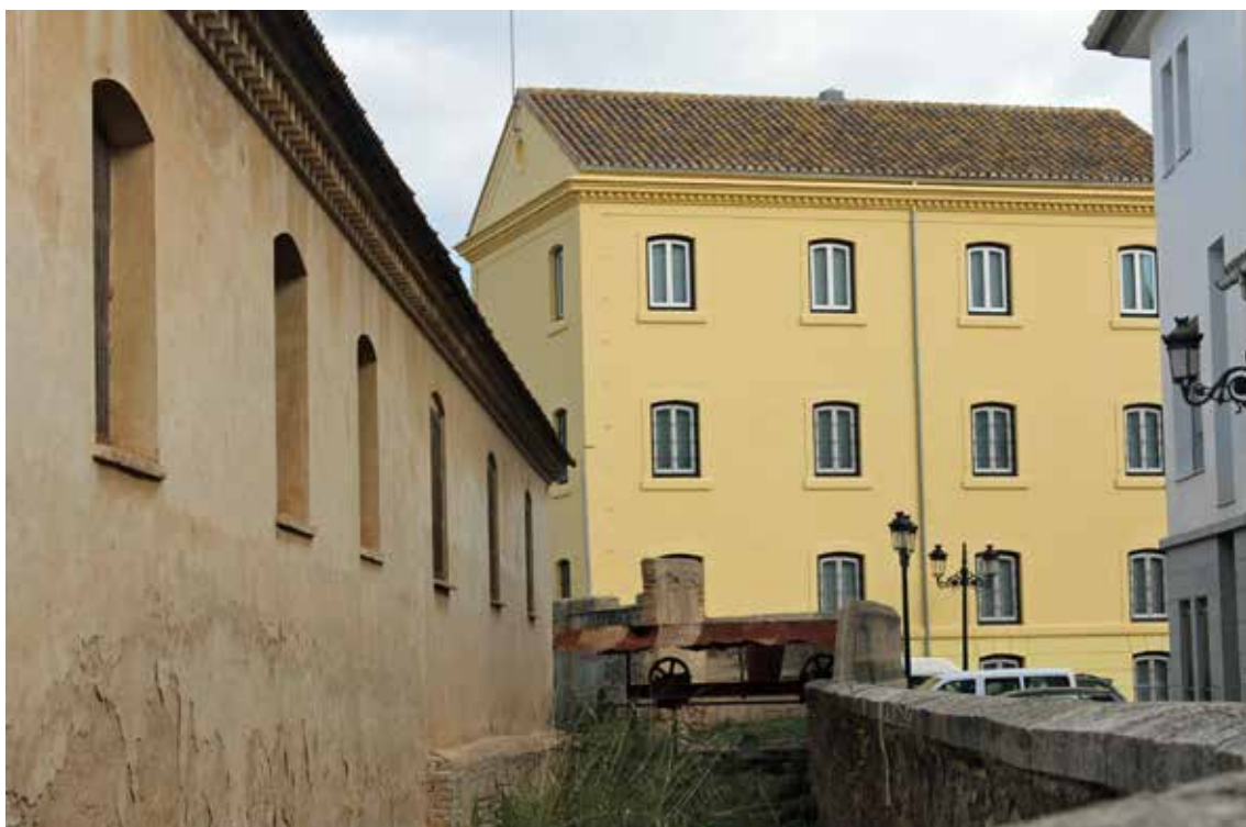
Molí fariner del Passiego.