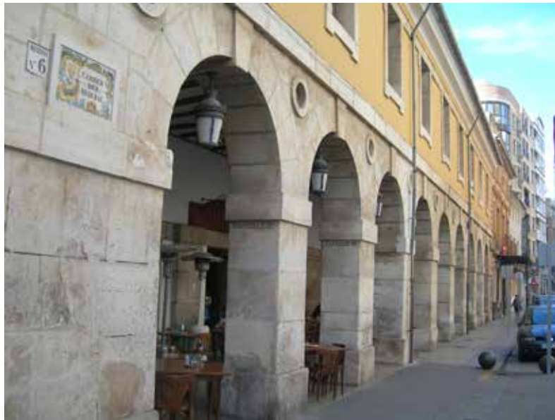
Carrer del Sequial.