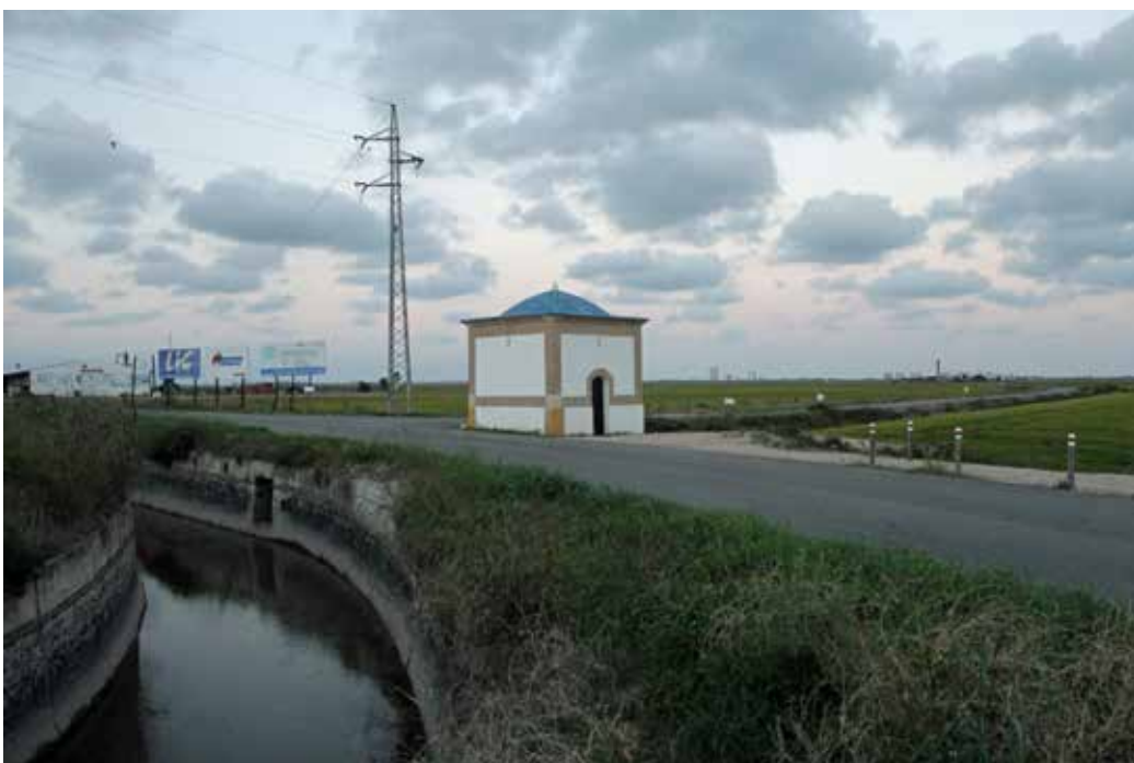
Cano del Garrofi.