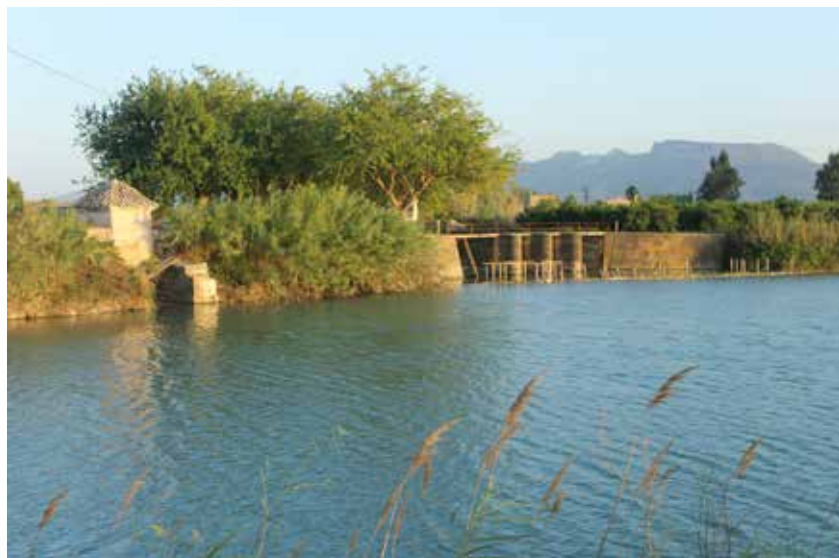
Cano de la séquia dels Quatre Pobles.