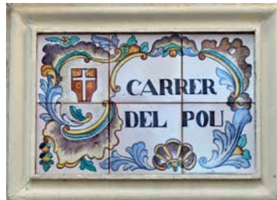
Carrer del Pou.