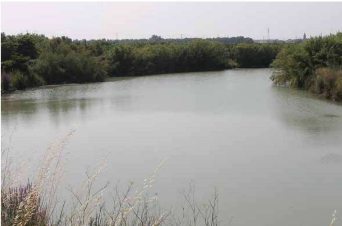
Riu Xúquer, el Devastador.

Pels 93 km quadrats del terme de Sueca, corren 26 filloles que beuen de la séquia Major, nascuda directament del riu Xúquer, el Devastador, al llarg d'11 km. Els caixers de les séquies han modelat el paisatge suecà des de sempre i han convertit l'aigua en una font de riquesa i en una part indestriable del nostre territori. Com el riu, la mar i el muntanyàs.