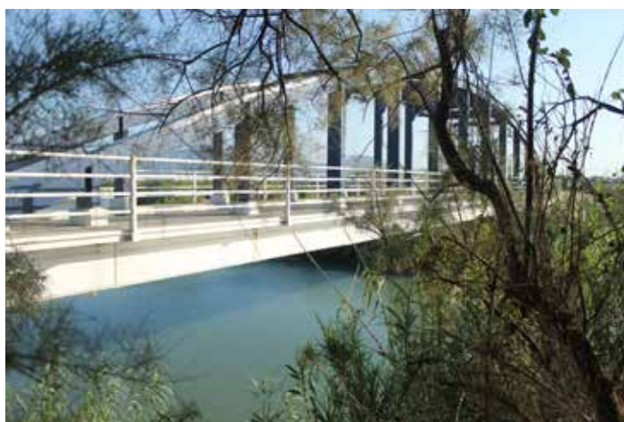
El pont de Ferro i el riu Xúquer.