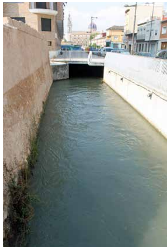
El Sequial, en el tram de la ciutat.