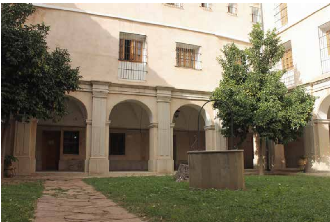
Pou del claustre del convent dels Franciscans.