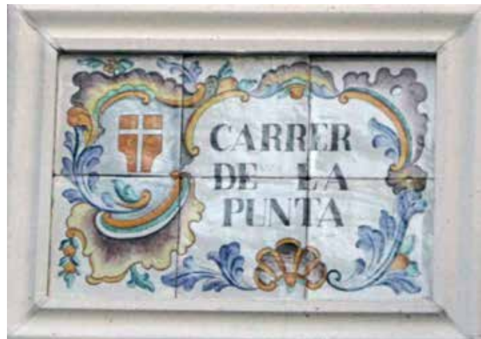
Carrer de la Punta.