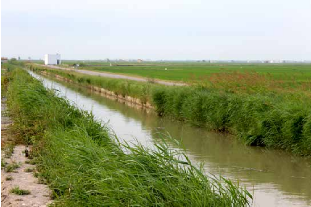
Séquia el Canal.

És necessari que ens sentim part del territori on hem nascut i vivim, però per a fer-ho, les nostres emocions també s'han de lligar al paisatge i a les criatures que l'habituen. Conèixer quin sentit té la xarxa de séquies que envolta Sueca, com es va crear i per què, recórrer el Xúquer al seu pas prop de la ciutat, i recordar quin va ser el nostre origen pot ajudar-nos i divertir-nos.